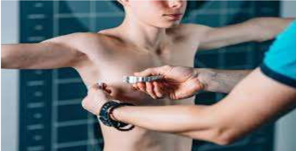
Ko'krak qafasi aylanasini o'lchash

Ko'krak qafasi aylanasini santimetrli lenta bilan oldingi tomondan to'rtinchi qovurg'a bo'yicha, orqa- dan esa kuraklarning burchaklari ostidan o'lchanadi. Bemorning qo'llari pastga tushirilgan bo'lishi, va u tinch nafas olishi lozim. O'lchash nafas chiqarish vaqtida, shuningdek maksimal nafas olish cho'qqisida bajariladi.