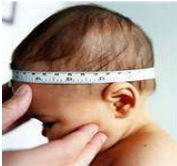
Bosh aylanasini o'lchash

O'pkaning tiriklik sig'imi — spirometr asbobida o'lchanadi. Buning uchun bemor chuqur nafas olib, spirometr asbobiga puflaydi. Erkaklarda normada o'pkaning tiriklik sig'imi ayollarnikiga qaraganda katta bo'ladi.